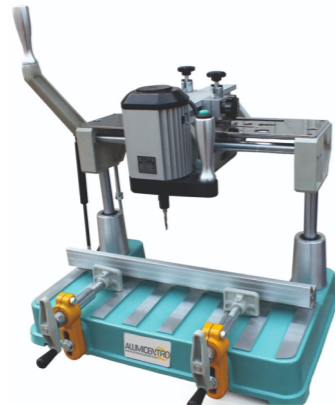
PANTÓGRAFO PORTÁTIL COM MOTOR INDUSTRIAL SMART BM