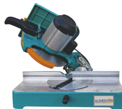
MÁQUINA DE CORTE E REFILADEIRA FIRST-300