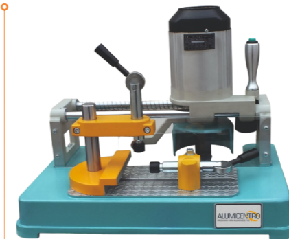
ENTESTADEIRA PORTÁTIL MODELO "FORM"