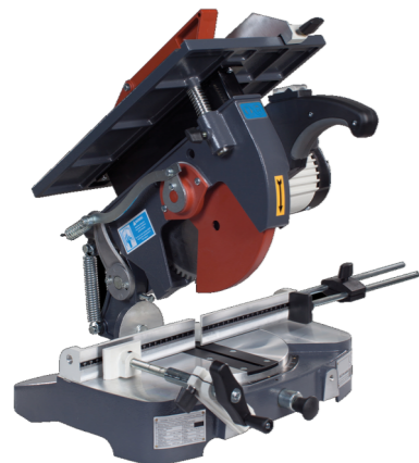
MÁQUINA DE CORTE/REFILADEIRA "ALFA MINI"