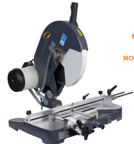
MÁQUINA DE CORTE PORTÁTIL DISCO 400 mm MODELO "VEGA 1400"

Esta monocabeça profissional consagrada nas indústrias de esquadrias, por sua solidez e precisão nos cortes de 45° a 90°. Possui mesa giratória, base reforçada e montada sobre esferas de aço.