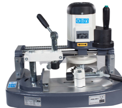
ENTESTADEIRA PORTÁTIL MODELO "POLAR I"