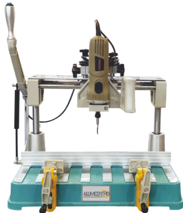
PANTÓGRAFO PORTÁTIL MODELO SMART KM