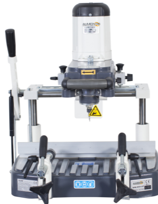
PANTÓGRAFO PORTÁTIL MODELO "GALAXY IP"