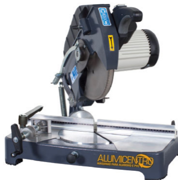
MÁQUINA DE CORTE PORTÁTIL DISCO 300 mm MODELO "ALFA S"