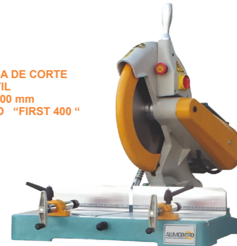
MÁQUINA DE CORTE PORTÁTIL DISCO 400 mm MODELO "FIRST 400"